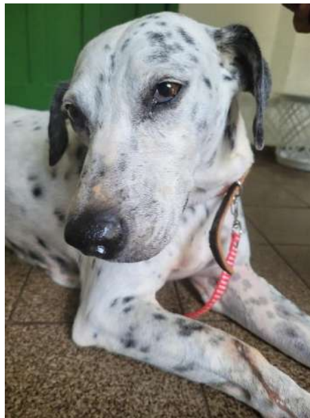
Figura 4 - Paciente Bolinha

Foi atendido na Clínica Escola Veterinária ESFA Dr. Laurindo Costa Neto, em Santa Teresa, Espírito Santo, no dia 06/02/2024 um animal chamado Bolinha, da espécie canina, macho, castrado, 12 anos, da raça Dálmata, pesando 20,3 kg.