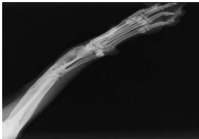
Figura 13 - MTD após a retirada da placa ponte bloqueada

Após esse procedimento foi pedido 10 dias de retorno para uma nova radiografia para o acompanhamento do processo evolutivo do animal. Onde foi observado uma melhora significativa em seu prognóstico, este se encontrava sem claudicação do MTD e sem reatividade de dor ao realizar manipulação dele. A radiografia demonstra uma maior densidade óssea, com diminuição de tumefação dos tecidos moles e uma neoformação tecidual do osso.