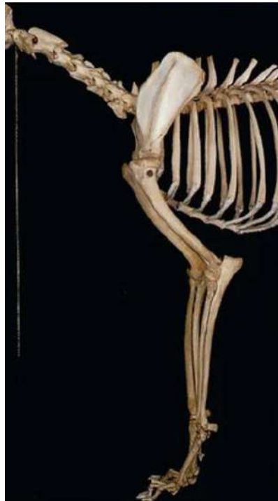
Figura 1 – Anatomia membro torácico