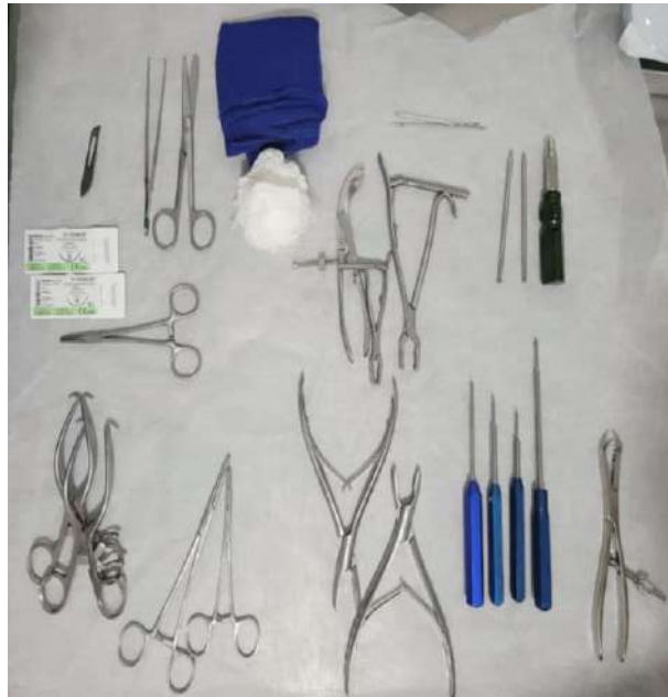
Figura 9 - Instrumentos cirúrgicos

A incisão foi feita com lâmina de bisturi 22 sobre a localização da placa em MTD, e os tecidos subjacentes são cuidadosamente divulsionados e dissecados (nervos e vasos sanguíneos) para expor a placa e os parafusos que a fixam (fig. 10).