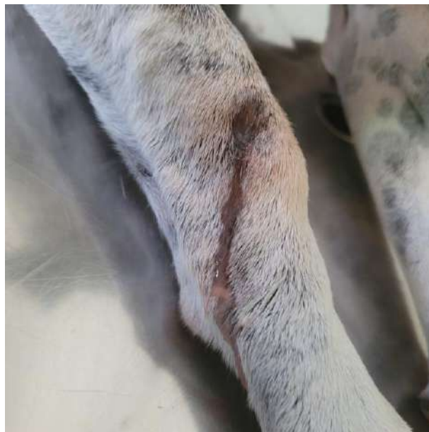
Figura 6 - Fístula dorsal em MTD com secreção.

Após 21 dias, o paciente retornou a clínica veterinária da ESFA e durante o exame físico foi perceptível que houve uma melhora da sensibilidade da dor e diminuição das fístulas presentes no local, porém ainda havia secreção purulenta. Dado o diagnóstico definitivo de osteomielite por meio da radiografia, o animal foi encaminhado para cirurgia, a fim de realizar o procedimento de retirada da placa ponte bloqueada.