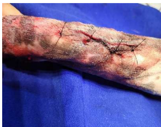
Figura 12 – Sutura padrão Wolf

Após a remoção da placa, foi realizada a sutura, utilizando nylon 2-0 padrão Wolf em pele. O procedimento durou cerca de 30 minutos, como medicações administradas no pós-operatório imediato foram feitos Maxican (0,2mg/kg) SC, Agemox (amoxicilina) (25mg/kg) IM e Dipirona sódica (1mg/kg) SC.