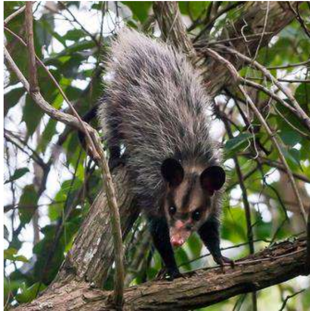
Figura 3 – Didelphis aurita