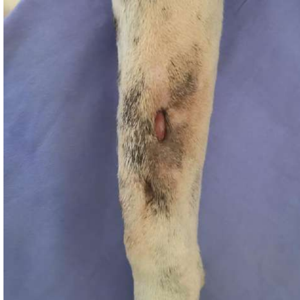
Figura 7 - Fístula lateral em MTD