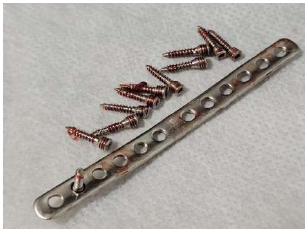
Figura 11 - Placa ponte bloqueada retirada do MTD

Com a exposição da mesma, o cirurgião ortopédico removeu os parafusos e desconectou a placa do osso, nessa hora o anestesiologista aprofundou o isoflurano e fez um bolus de fentanil, pois todos os parâmetros fisiológicos do animal alterou, chegando a FC 95 BPM, FR 60 MPM e PAS 100 mmHG, indicando que o animal estava em plano superficial da anestesia, com essa intervenção o animal entrou em plano anestésico ideal novamente.