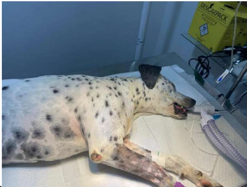
Figura 8 – Paciente em plano anestésico

No protocolo anestésico, foi usado como medicação pré-anestésica morfina (0,5 mg/kg) e Acepromazina (0,05mg/kg) IV, na indução anestésica Propofol 2mg/kg IV e como medicação transoperatória Fentanil 5mcg/kg IV. Procedeu-se então a intubação, utilizando traqueotubo número 8. Para a manutenção cirúrgica, optou-se por anestesia inalatória com Isoflurano em vaporizador universal.